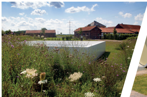
Das Kunstwerk „Black Circle Square“.