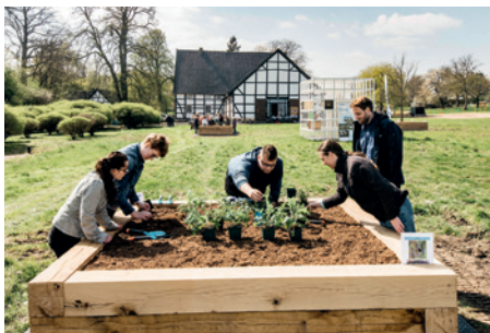
Hochbeete bieten den Wildbienen die passende Nahrung.