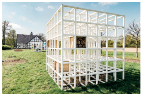
Die „Wild-Bienenhäuser“ des schwedischen Künstlers Henrik Håkansson.