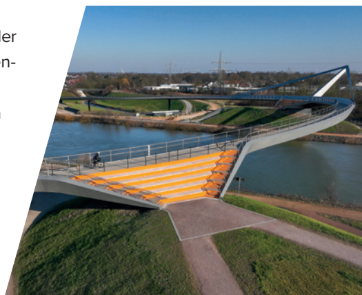
Die neue Brücke ist eine Landmarke der Region.

über die Emscher“ überqueren. Die Brücke stellt eine neue Verbindung der Castrop-Rauxeler Stadtteile Henrichenburg und Habinghorst mit der Stadt Recklinghausen her und schließt sich direkt an den Natur- und Wasser-Erlebnis-Park an.