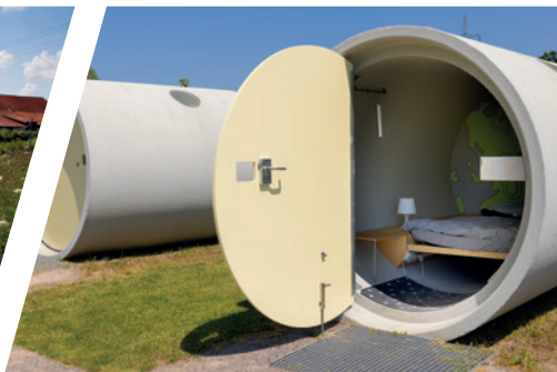
Auf dem Hof kann man in Kanalrohren übernachten.