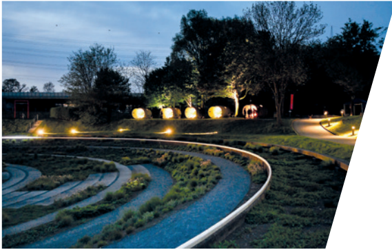
Der BernePark bei Nacht.