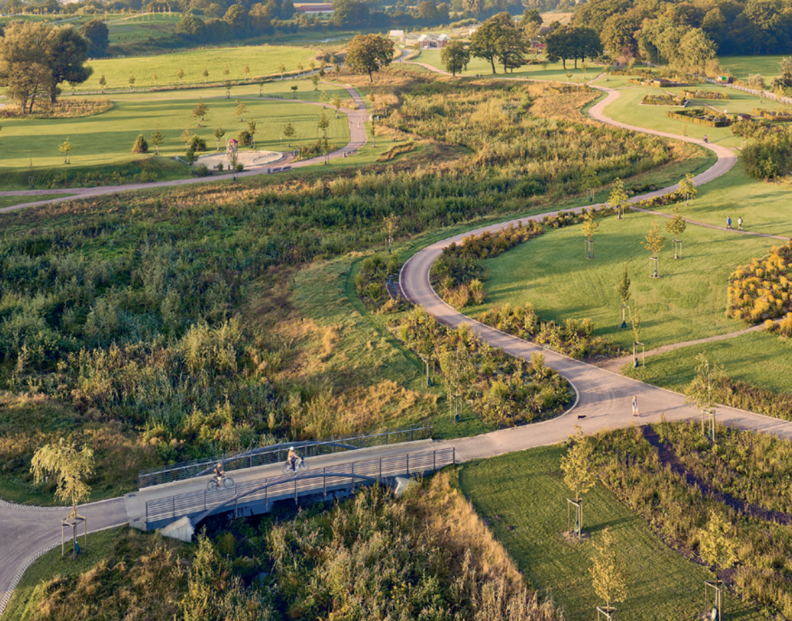
Der Natur- und Wasser-Erlebnis-Park bietet vielfältige Erholungsmöglichkeiten.

über die Emscher“ überqueren. Die Brücke stellt eine neue Verbindung der Castrop-Rauxeler Stadtteile Henrichenburg und Habinghorst mit der Stadt Recklinghausen her und schließt sich direkt an den Natur- und Wasser-Erlebnis-Park an.