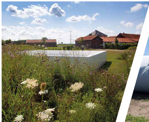
Das Kunstwerk „Black Circle Square“.