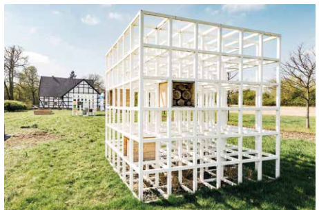
Die „Wild-Bienenhäuser“ des schwedischen Künstlers Henrik Håkansson.