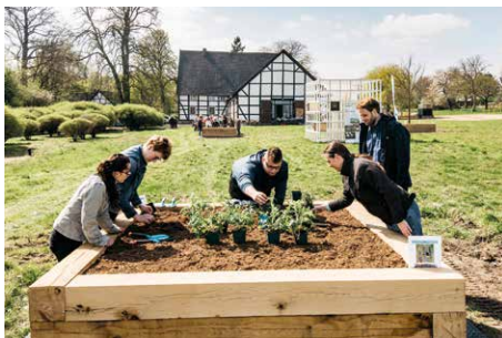
Hochbeete bieten den Wildbienen die passende Nahrung.