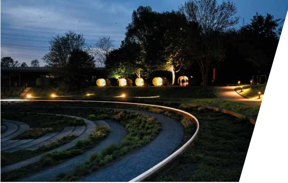
Der BernePark bei Nacht.