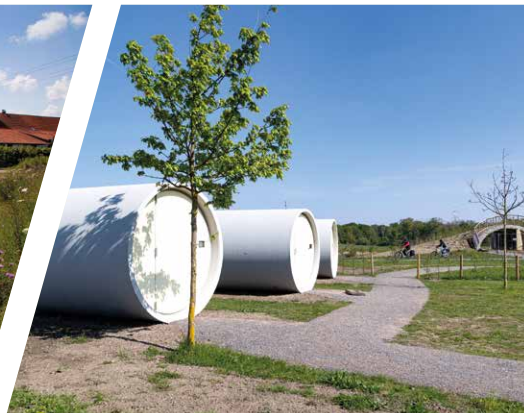
Auf dem Hof kann man in Kanalrohren übernachten.

Café und Sonnenterrasse laden zum Verweilen und Entspannen bei kleinen Snacks und Getränken ein. Seit Ende 2017 ist auch das Falken Bildungs- und Freizeitwerk Dortmund e.V. (FBF) auf dem Hof beheimatet. Die Emscher-Falken bieten Kinder- und Jugendarbeit für interessierte Besucher*innen an.