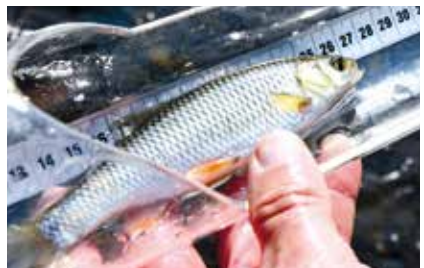
Monitoring von Gewässerqualität, Tier- und Pflanzenwelt