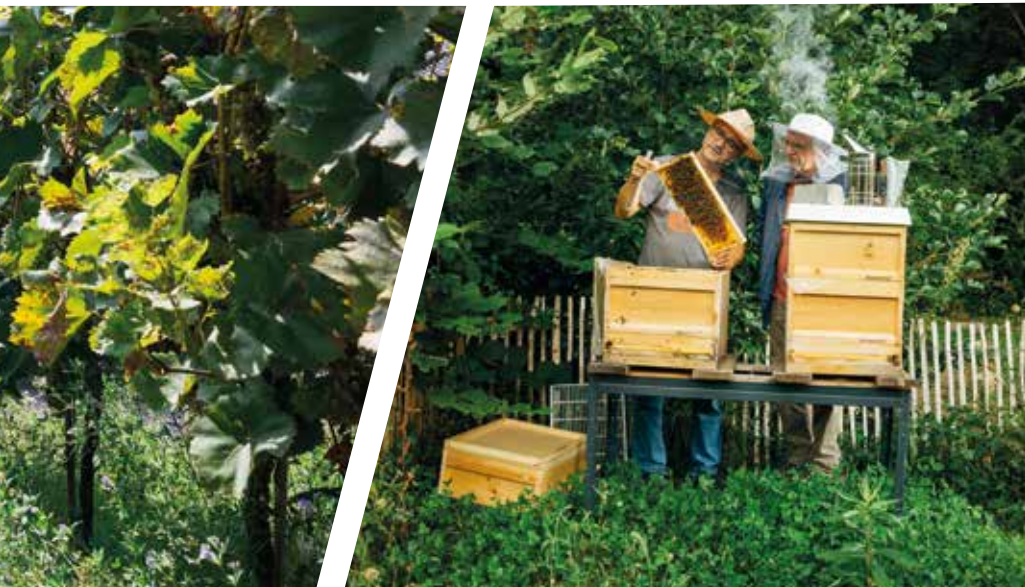
Kooperationen mit Imker*innen

Daher sind Erhalt und Wiederherstellung ursprünglicher Landnutzungsformen unverzichtbar für den Schutz der biologischen Vielfalt rund um die Gewässer.