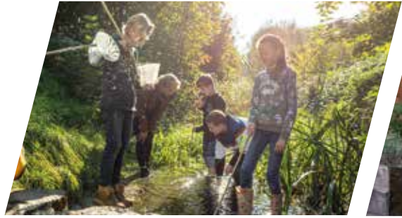
Exkursionen für Schulen