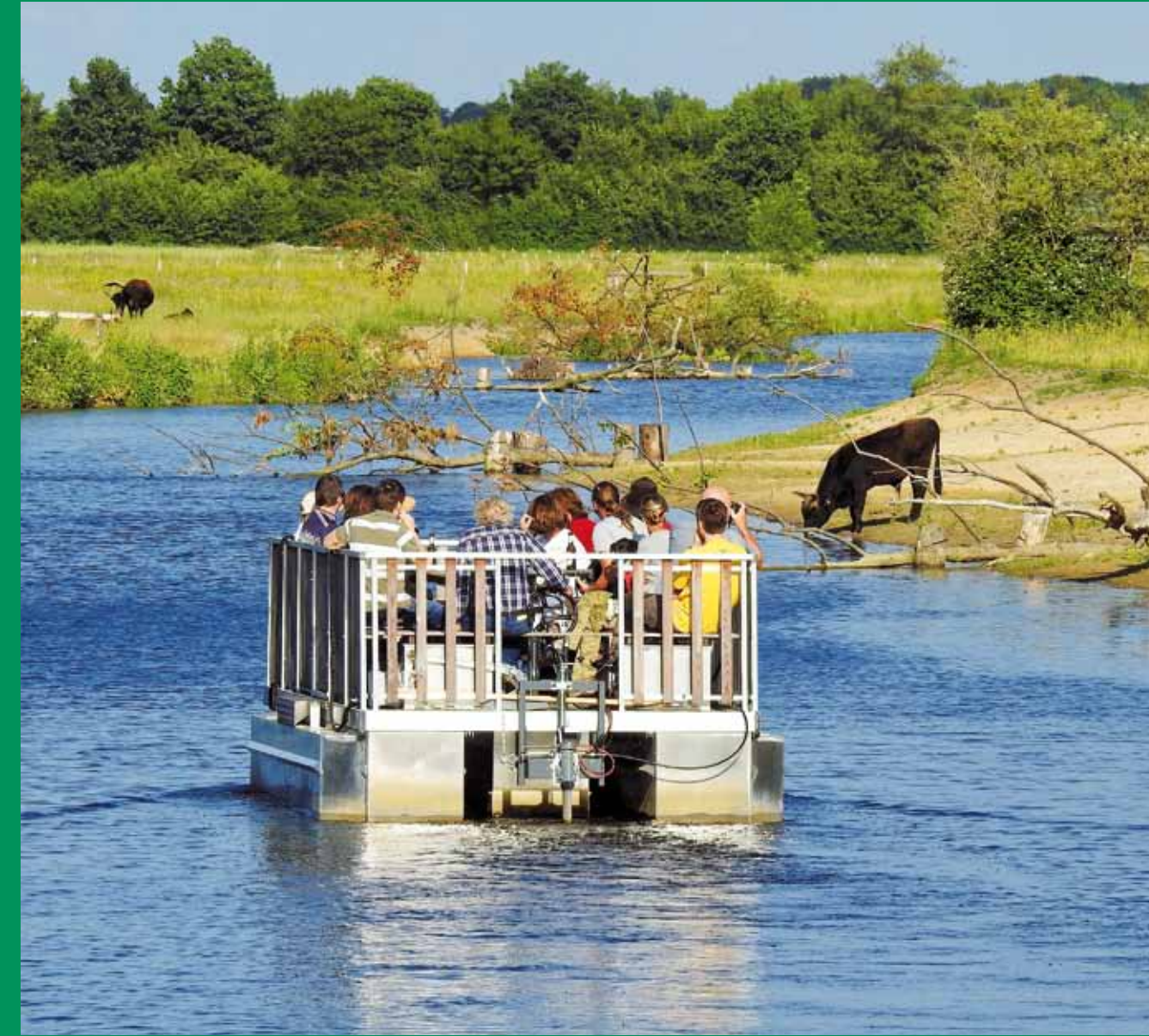
Die Route führt auch an der Steverraue in Olfen vorbei. Dort können Floßfahrten über die Stever gebucht werden.