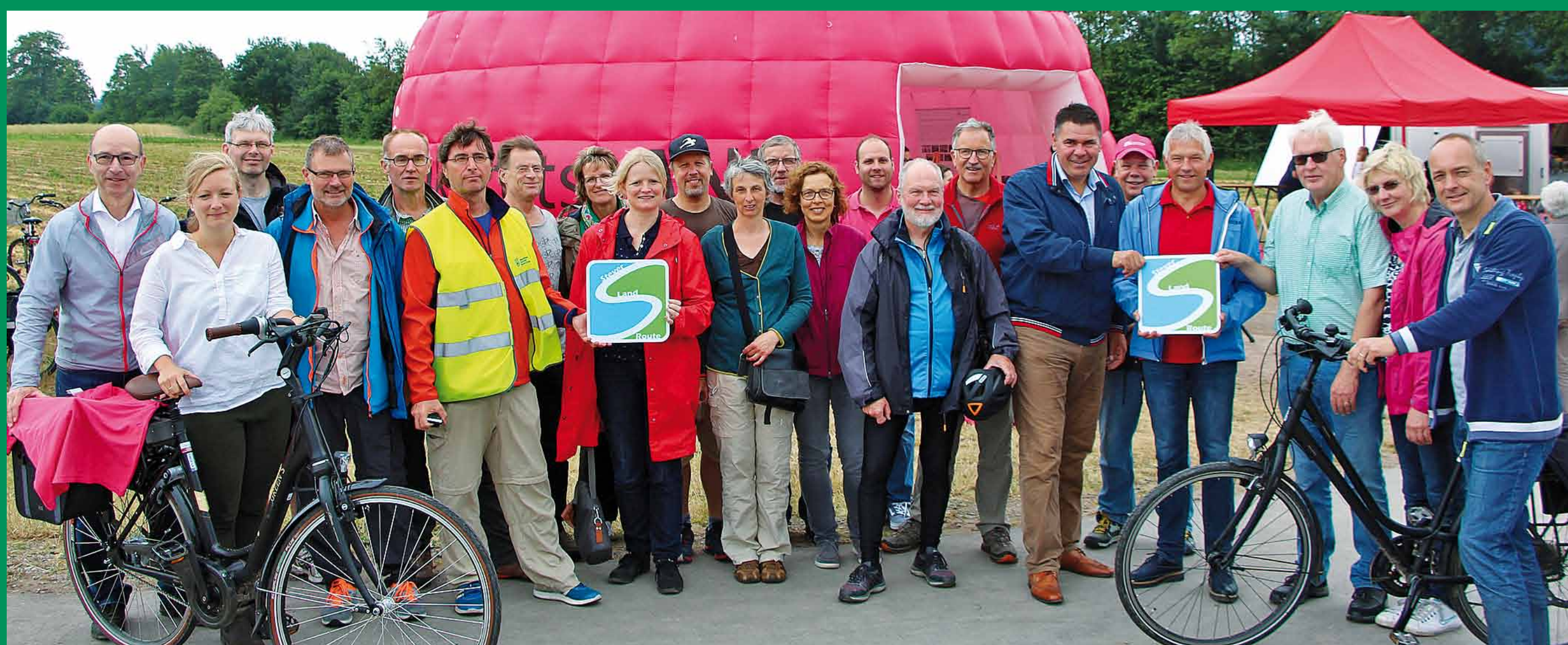
Probetour auf dem neuen Radweg mit Bürgermeistern und Akteuren.