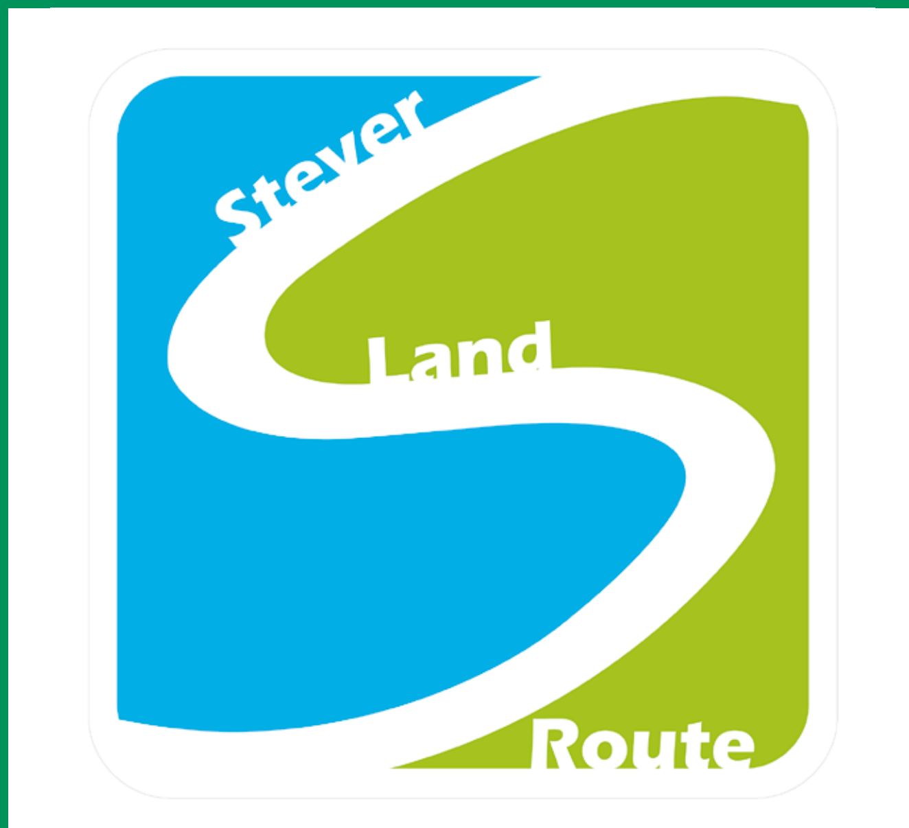
Das Logo der SteuerLandRoute wird ab 2019 die Strecke von der Quellregion bis zur Mündung in die Lippe markieren.