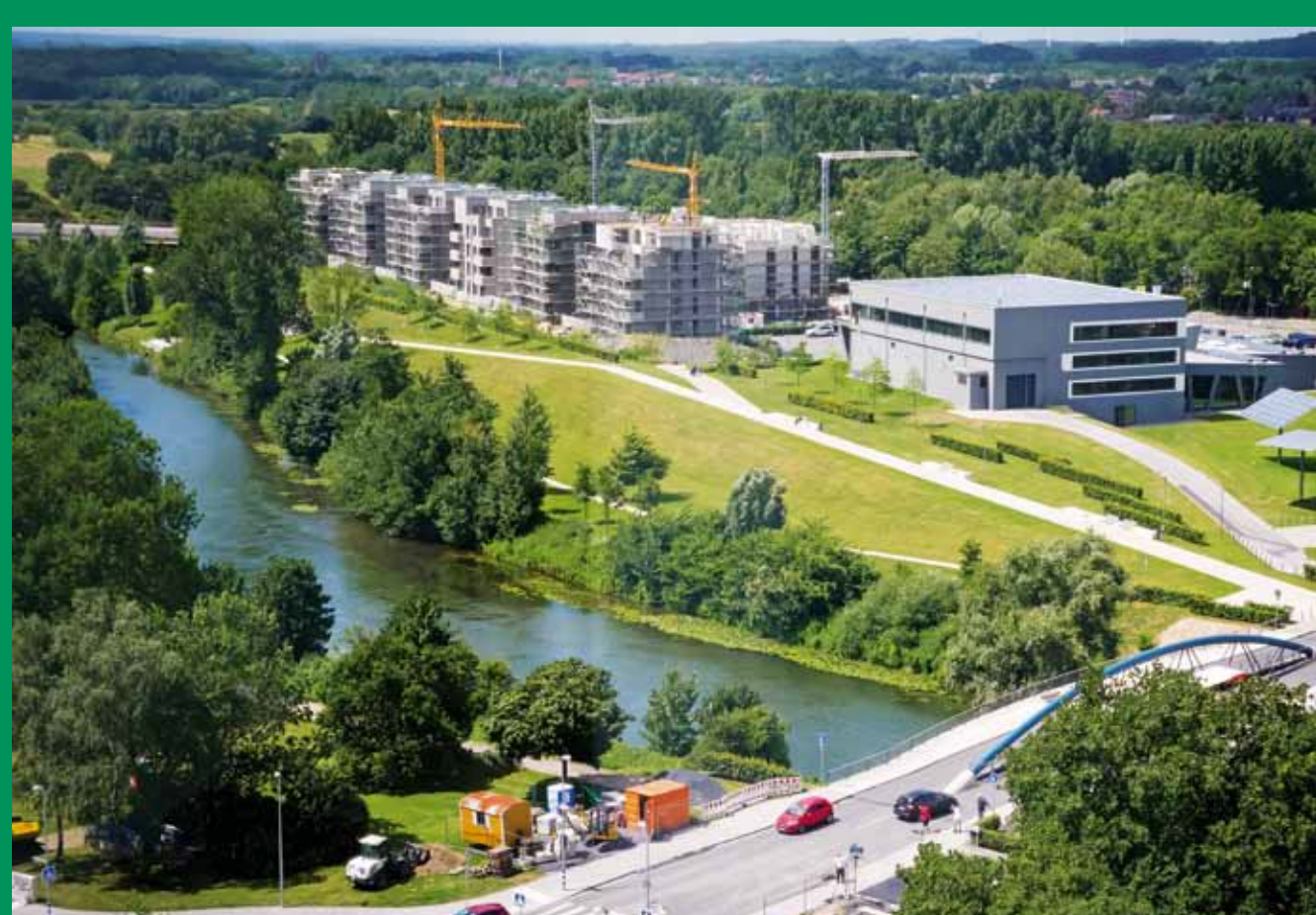
Wohnen am Wasser mit Lippe-Bad und Flusspark im Lippewohnpark", Foto: Günter Blaszczyk