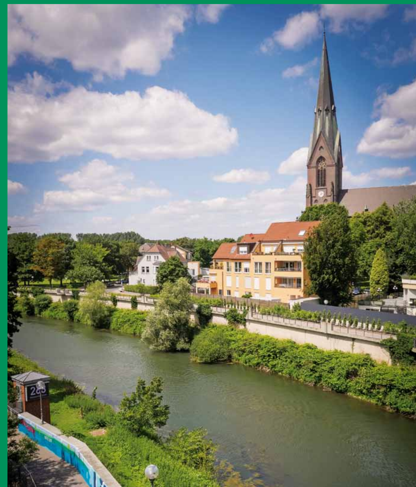
Lippepromenade von der Innenstadt in Richtung Flusspark. Unten gestaltete Lippemauer und Pegel- häuschen