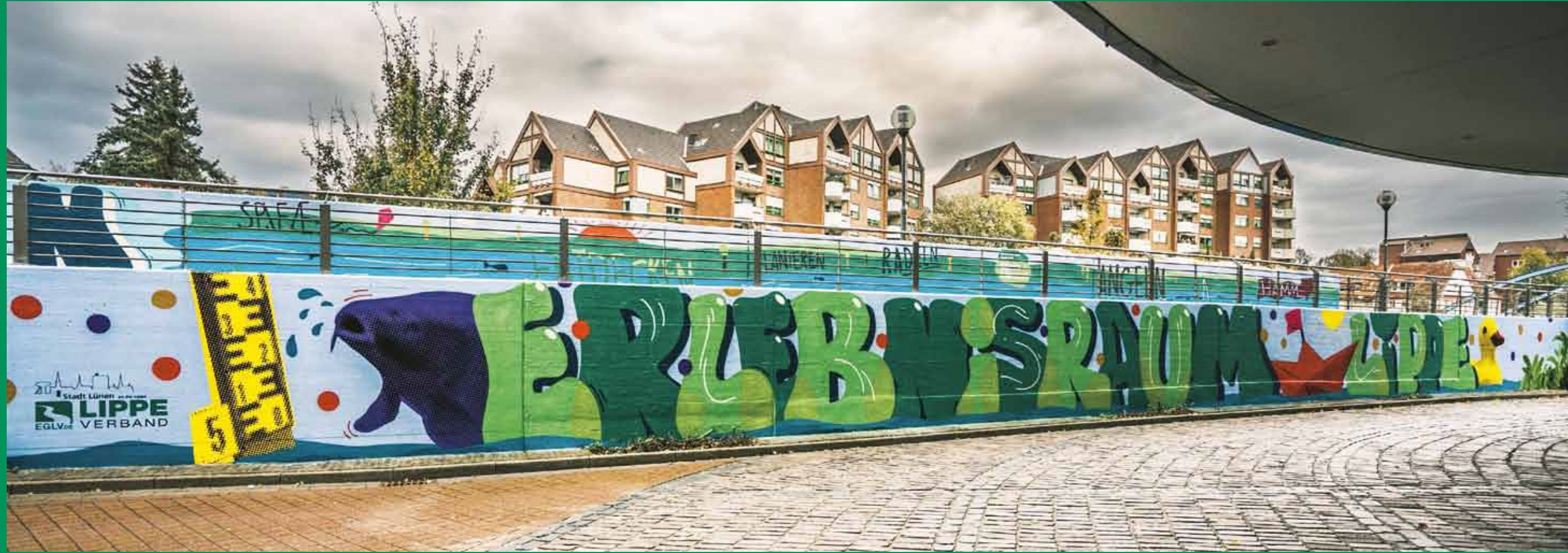
Innenmauergestaltung als Übergang zum Naturraum