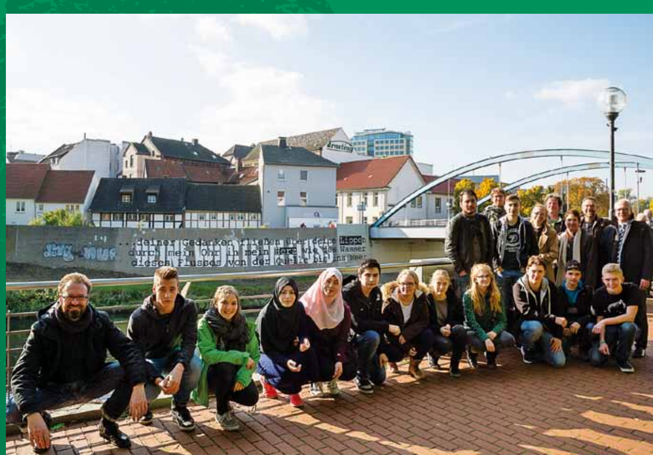
Projektgruppe Kunstwerk „Deine Worte im Fluss“