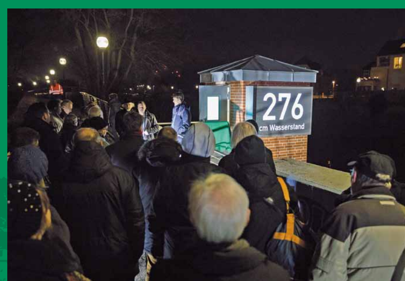
Pegelanzeige am historischen Pegelgebäude