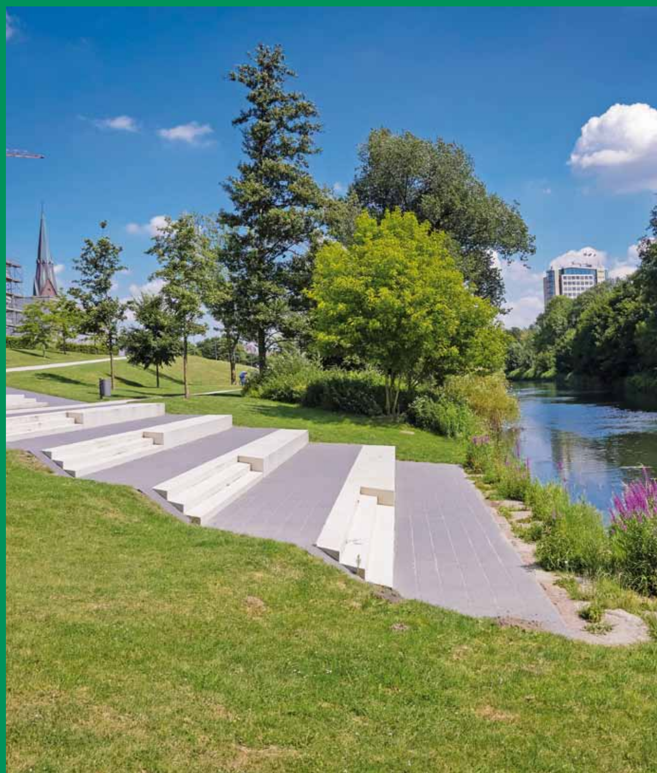
Zugang zum Wasser im Flusspark