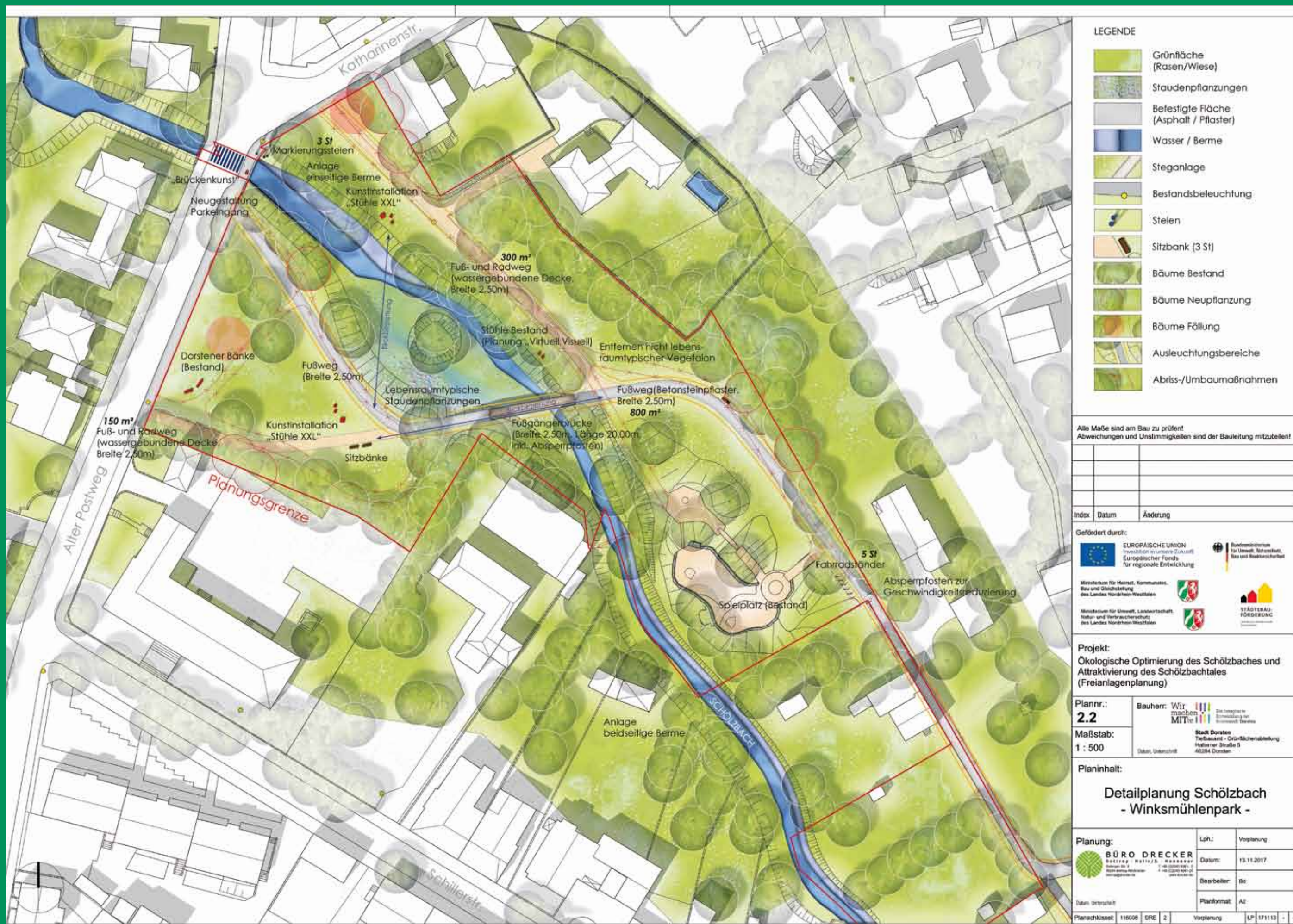
Schölzbach Fokusraum Winksmühlenpark