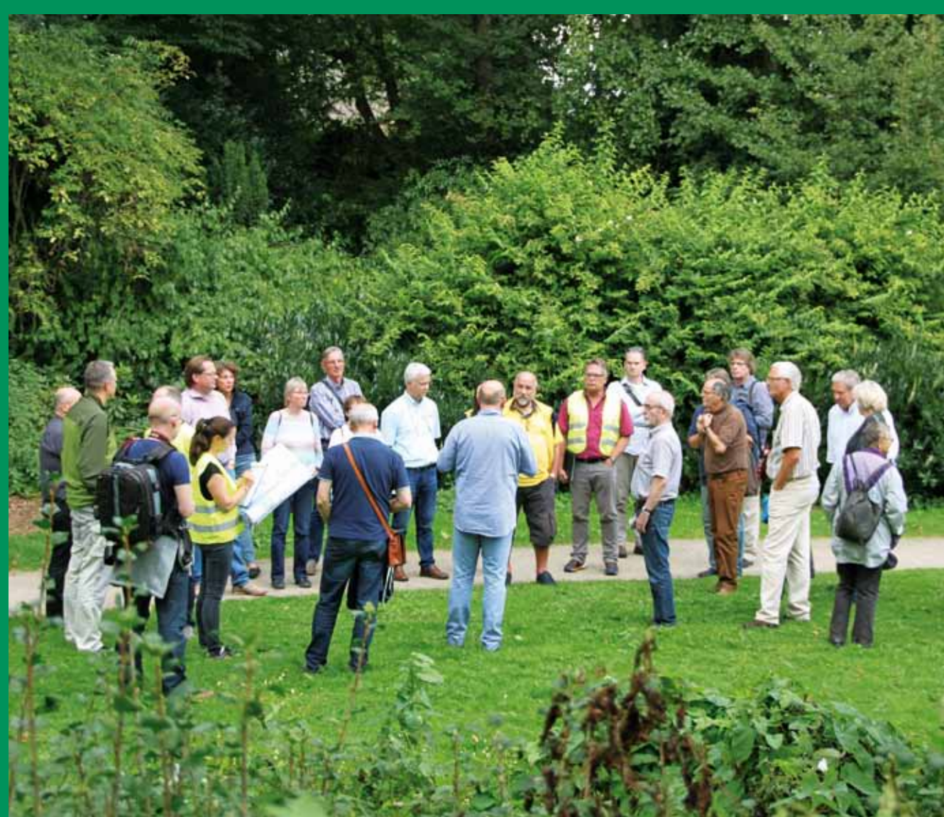
Spaziergang entlang des Schölzbaches zur Vorstellung der Vorentwurfsplanung