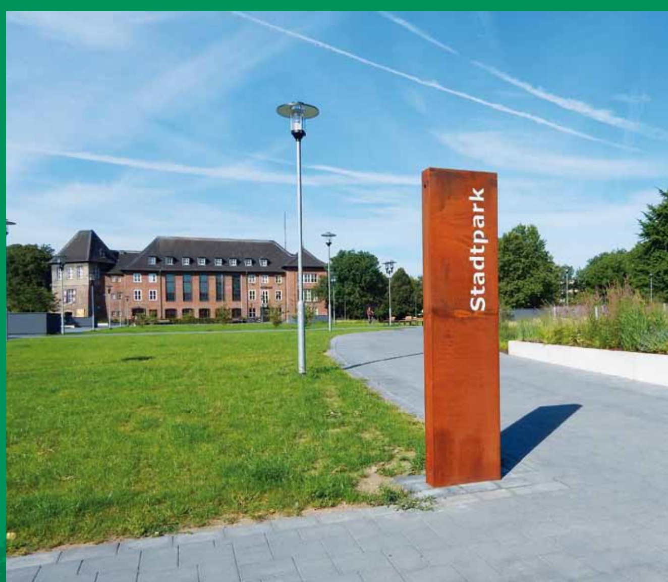
Eingangsstele am Stadtspark