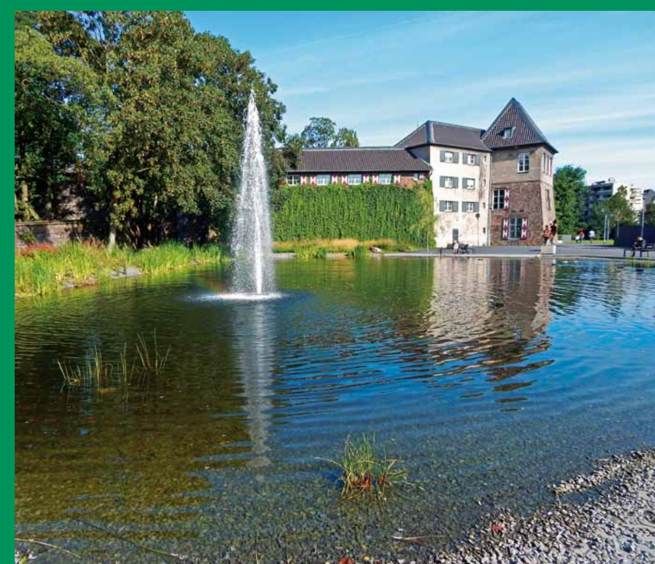
Rathaussteich mit Rathaus im Hintergrund