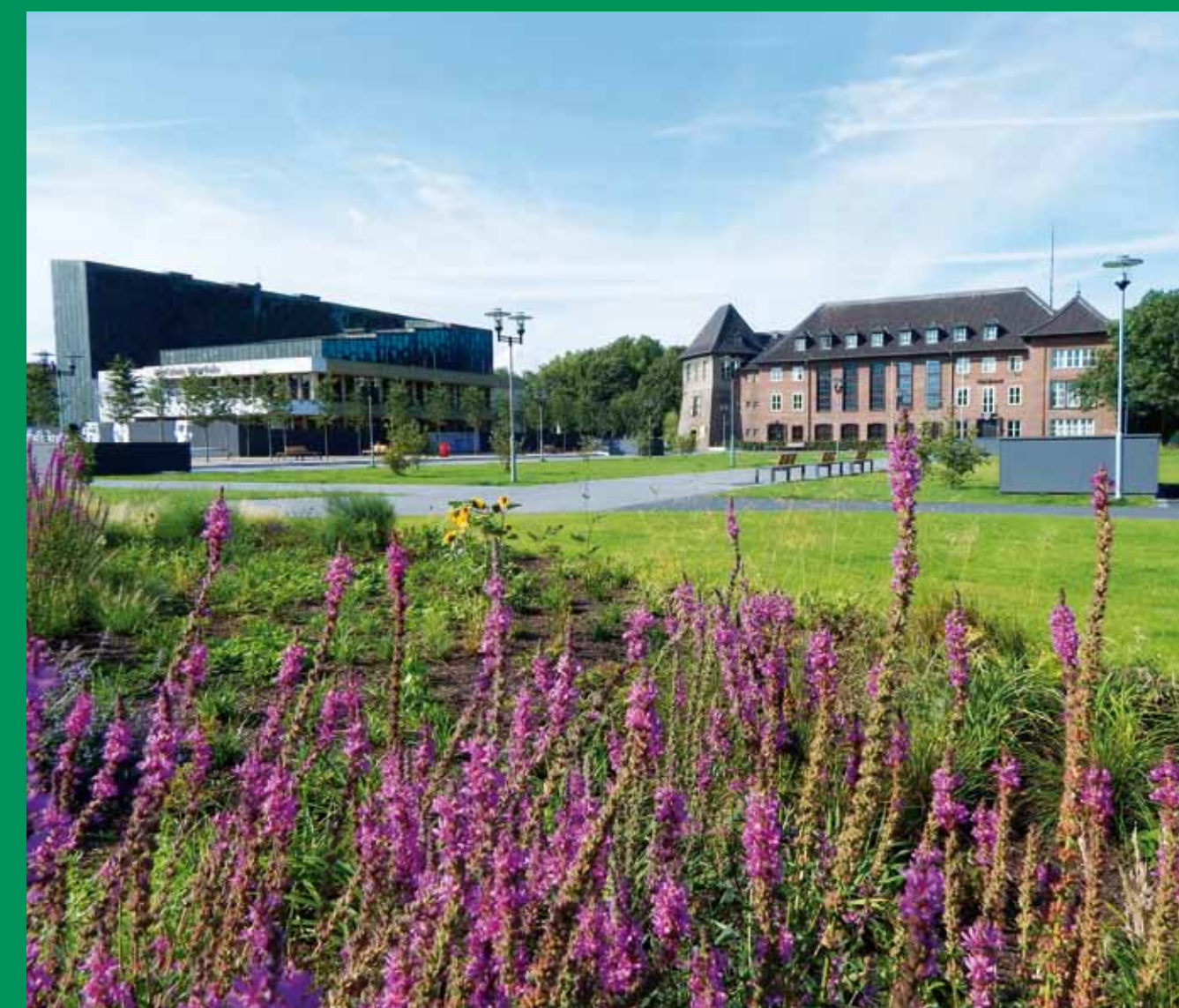
Rathaus und Kathrin-Türks-Halle