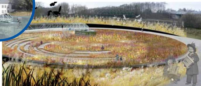
Senkgarten Piet Oudolf, GROSS.MAX