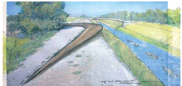
Hogarth's Dream Diemut Schilling